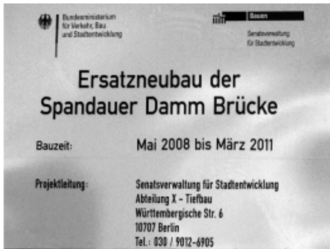
Bauschild zum Ersatzneubau