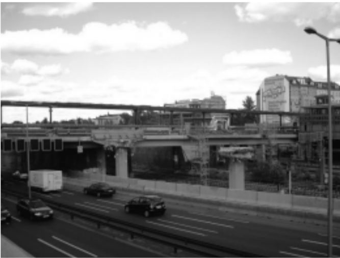
Abriss der Spandauer-Damm Brücke

Was FOCUS offenbar nicht wusste: seit Mitte August ist die schon vor Beginn der Bauarbeiten von Senatsseite empfohlene Ausweichroute über die Reichsstraße auch nur noch ein Schleichweg. Die meisten Westender Bürger haben verdutzt mit angesehen wie, offenbar hochgradig unkoordiniert, Kanalarbeiten zwischen Steubenplatz und Hessenallee begonnen wurden und noch bis Oktober andauern sollen. Die Reichsstraße ist, auf zwei Fahrspuren verengt, jetzt ordentlich "verkehrsberuhigt", Lärm und Gestank haben sich dafür vervielfacht.